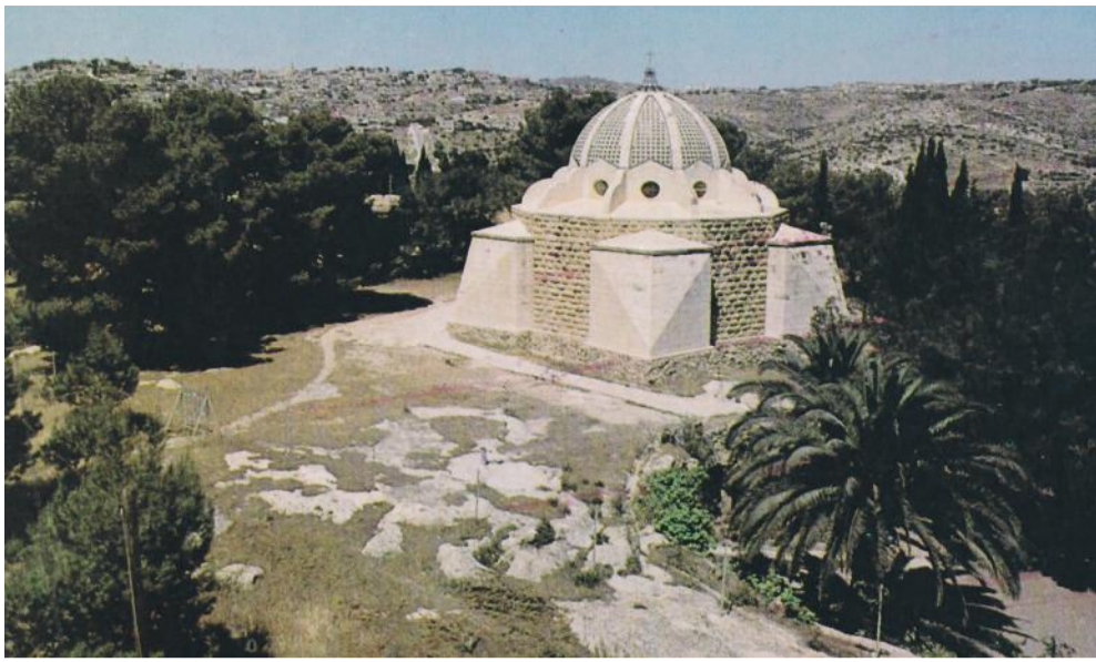
Belém - Igreja dos Pastores