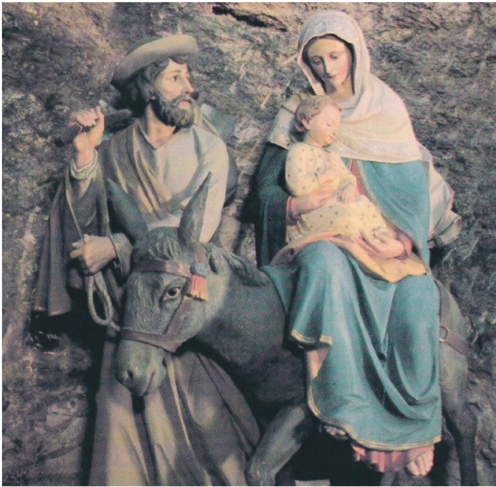
Belém - Igreja do Leite

Boas Festas Desejamos a todos os leitores um Santo Natal cheio de alegrias e graças