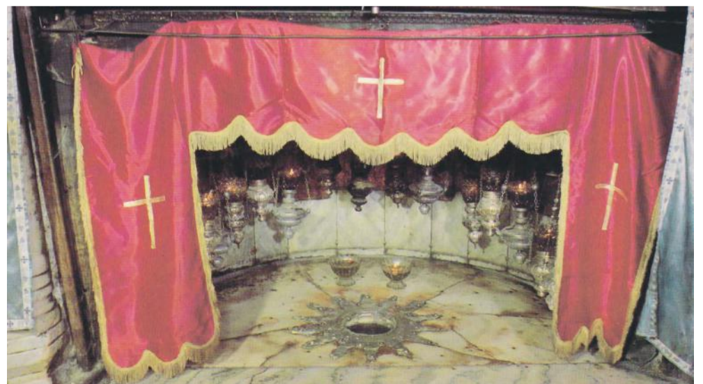
Belém - Gruta da Natividade