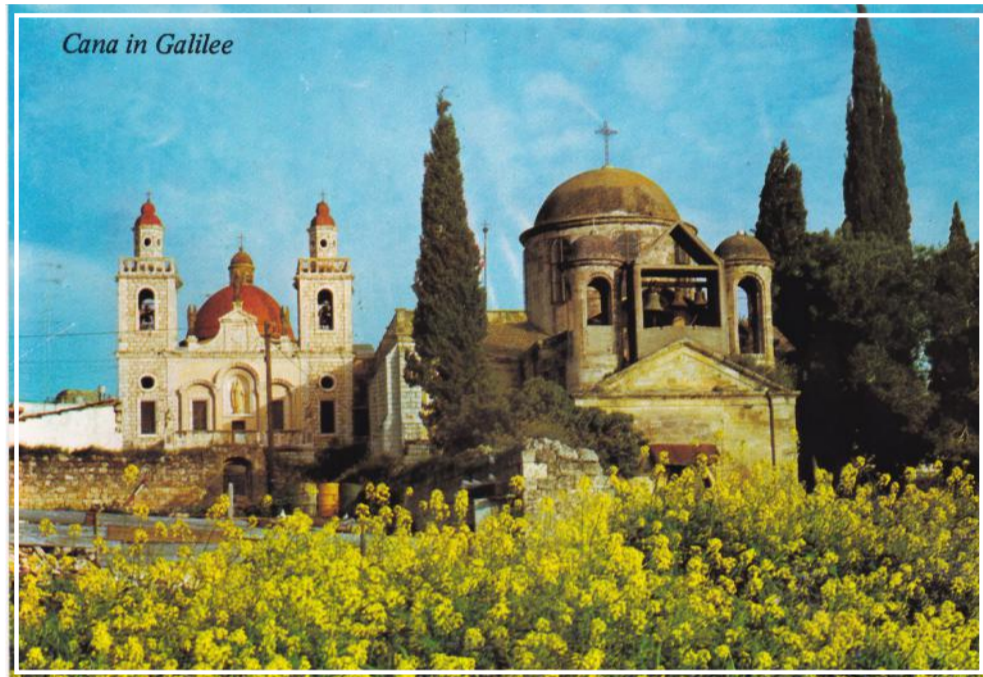
Cana in Galilee