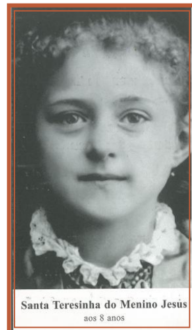
Santa Teresinha do Menino Jesus aos 8 anos